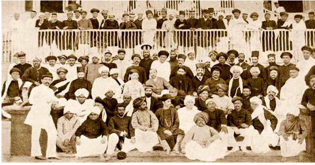
ब्रिटिश पंचायत राज