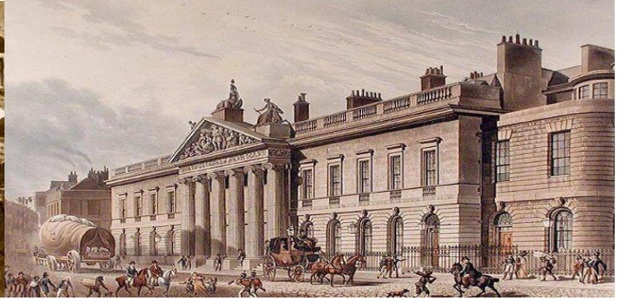
ईस्ट इंडिया कंपनी