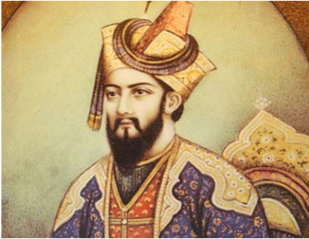
मुगल सम्राट बाबर