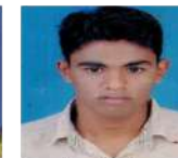
Amol Lonkar Ordnance Factory