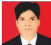
Kailash Khelukur Indian Security Press