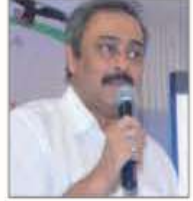
Mr. Sachin Khedekar Actor