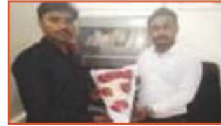
Arjun Awahad Krushi, Latur